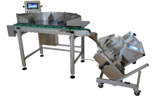
Abbildung 6: Der Sortiertisch LBX100 ergänzt die Verpackungsmaschine LVX300 zu einem vielseitigen Verpackungsarbeitsplatz.