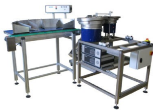
Abbildung 4: LBX100 Komplettlösung, Verpackungsanlage kombiniert mit einem LBX100 Sortiertisch und zwei Wendelförderer.