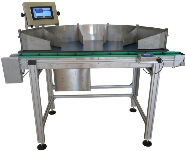
Abbildung 1: Sortiertisch mit Bandzuführung, normalerweise als Zuführung in eine Lauper LVX Verpackungsmaschine