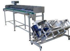
Abbildung 5: LBX100 Speziallösung, Extra langer Sortiertisch, kundenspezifisch konfigurierbar.