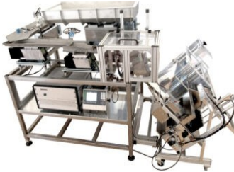
Abbildung 1: LZ100 – Zähl- und Wiegeanlage, kompakte Bauweise mit optimaler Zugänglichkeit