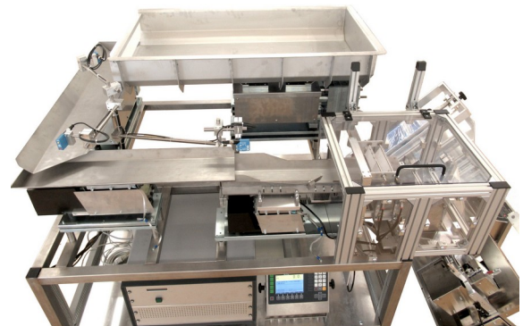
Abbildung 6: Kompakte Bauweise einer LZ100 Komplettanlage mit guter Zugänglichkeit. Die Aufstellung und anordnung wird auf Ihre Bedürfnisse individuell angepasst.

Ihre Anlage planen wir auf Ihre Bedürfnisse passend. Wir achten dabei auf eine kompakte und platzsparende Aufstellung, sowie eine einfache Bedienung und gute Zugänglichkeit.