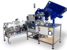
Abbildung 3: LZ100 – Zähl- und Wiegeanlage, kompakte Bauweise einer LZ100.