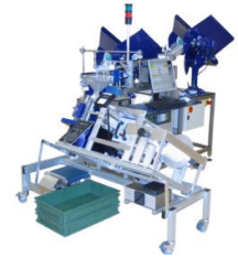
Abbildung 4: LZ100 – Zähl- und Wiegeanlage, mit zusätzlichem Wendelförderer und einer LV300 Verpackungsmaschine.