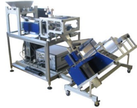
Abbildung 2: LZ100 Zähl- und Wiegeanlage, „einfacher“ Horizontalförderer mit Grob- und Feindosierung