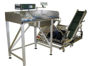
Abbildung 6: LT100 – Komplettlösung, Einfacher Zähl- und Wiegetisch mit anschliessender LV500 Verpackungsmaschine und Abtransportband.