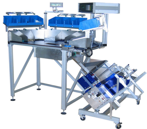
Abbildung 2: LT100 – Komplettlösung, Zähl- und Wiegetisch mit 20 unterschiedlichen Komponenten und einer LV300 Verpackungsmaschine.