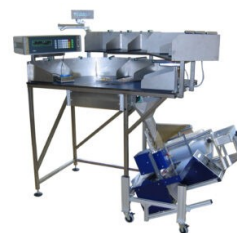
Abbildung 5: LT100 – 12 Komponenten, Zähl- und Wiegetisch mit 12 unterschiedlichen Komponenten und einer LV500 Verpackungsmaschine.