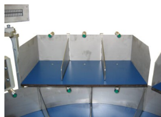
Abbildung 4: LT100 – modularer Aufbau, durch die modulare Bauweise können wir Ihre Bedürfnisse realisieren.