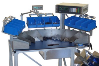
Abbildung 3: LT100 – 20 Komponenten, Zähl- und Wiegetisch mit 20 unterschiedlichen Komponenten. Grüne Signallichter zeigen die zu zählende Komponente an.

Der Zähl- und Wiegetisch LT100 ist modular aufgebaut und lässt sich auf Ihre Wünsche konfigurieren. Lassen Sie sich von den Beispielen inspirieren.