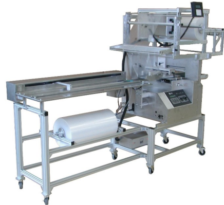
Abbildung 1: LHX550 Standard, mit 1000mm Einschieber, Druckerrahmen und Gestell auf Rollen