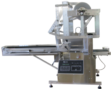
Abbildung 2: LHX350 Standard, mit 800mm Einschieber, ohne Gestell (nur bei 800mm Einschieber möglich)

Unsere horizontalen Schlauchbeutel-Verpackungsmaschinen der neusten LHX-Generation überzeugen durch eine einfache Bedienung und die konsequent umgesetzte Modulbauweise. Alle unsere Verpackungsmaschinen werden komplett in unseren Haus entwickelt, gefertigt und produziert.